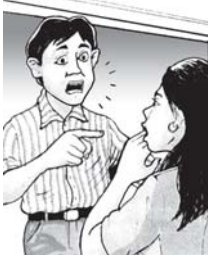
Sumber: PR, Februari 2003

"Kamu ini mbok jangan keblinger to, Dir, Kadir. Nggak enak kan terhadap orang-orang."