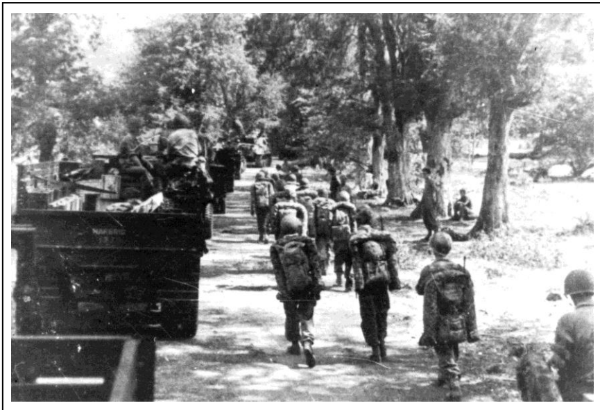
Tentara Belanda Mengadakan Penyerangan pada Agresi Militer Belanda I di Jawa Barat tanggal 21 Juli 1947