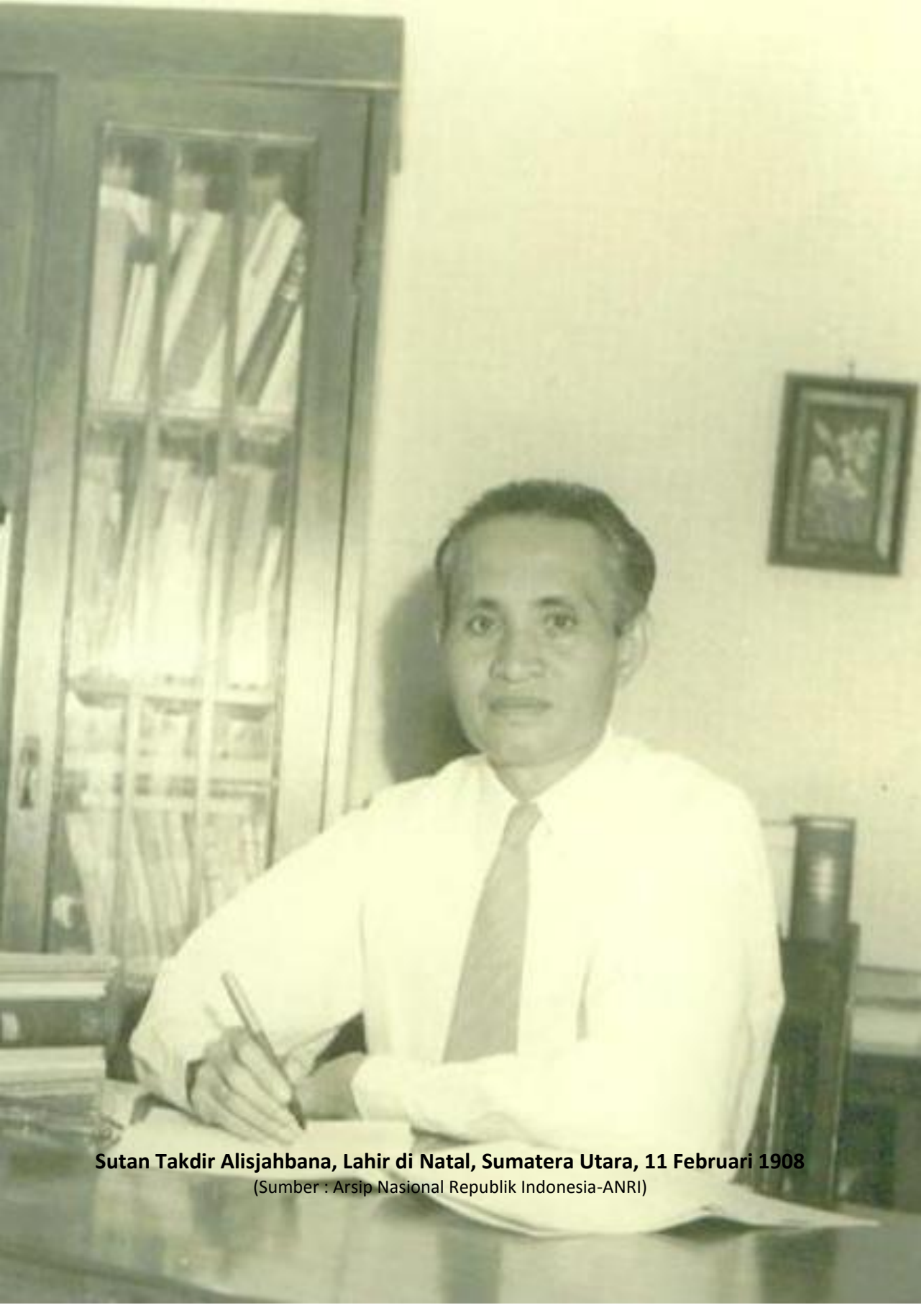
Sutan Takdir Alisjahbana, Lahir di Natal, Sumatera Utara, 11 Februari 1908