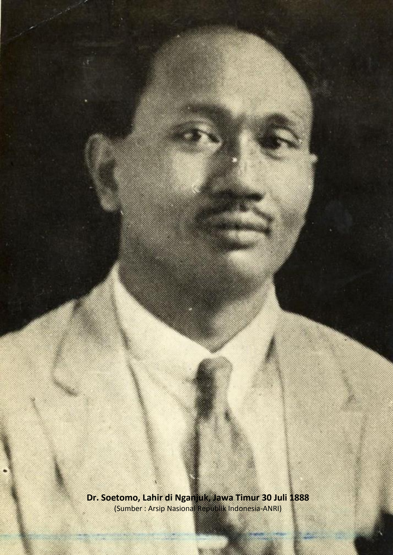
Dr. Soetomo, Lahir di Nganjuk, Jawa Timur 30 Juli 1888

(Sumber : Arsip Nasional Republik Indonesia-ANRI)