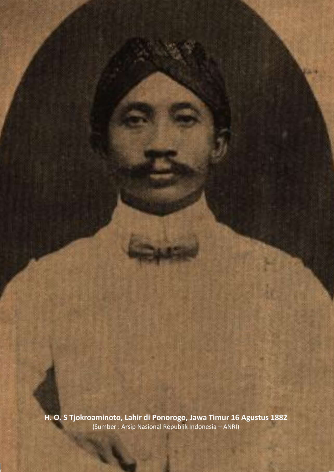
H. O. S Tjokroaminoto, Lahir di Ponorogo, Jawa Timur 16 Agustus 1882