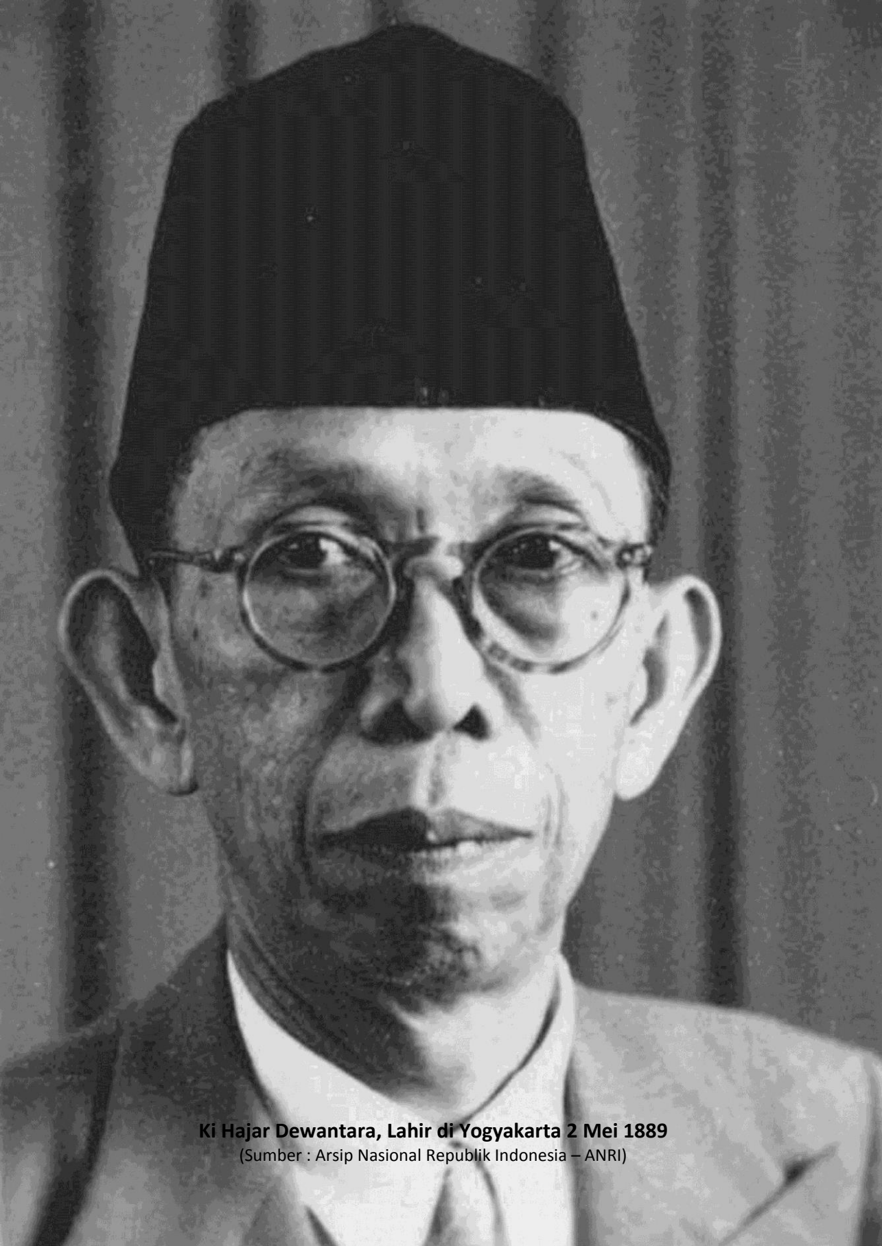
Ki Hajar Dewantara, Lahir di Yogyakarta 2 Mei 1889