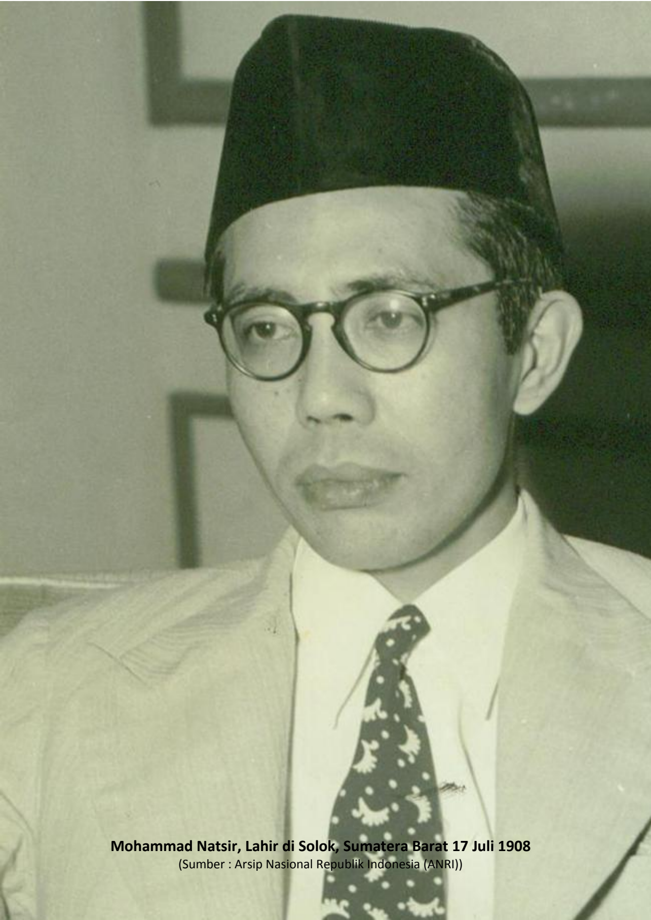
Mohammad Natsir, Lahir di Solok, Sumatera Barat 17 Juli 1908