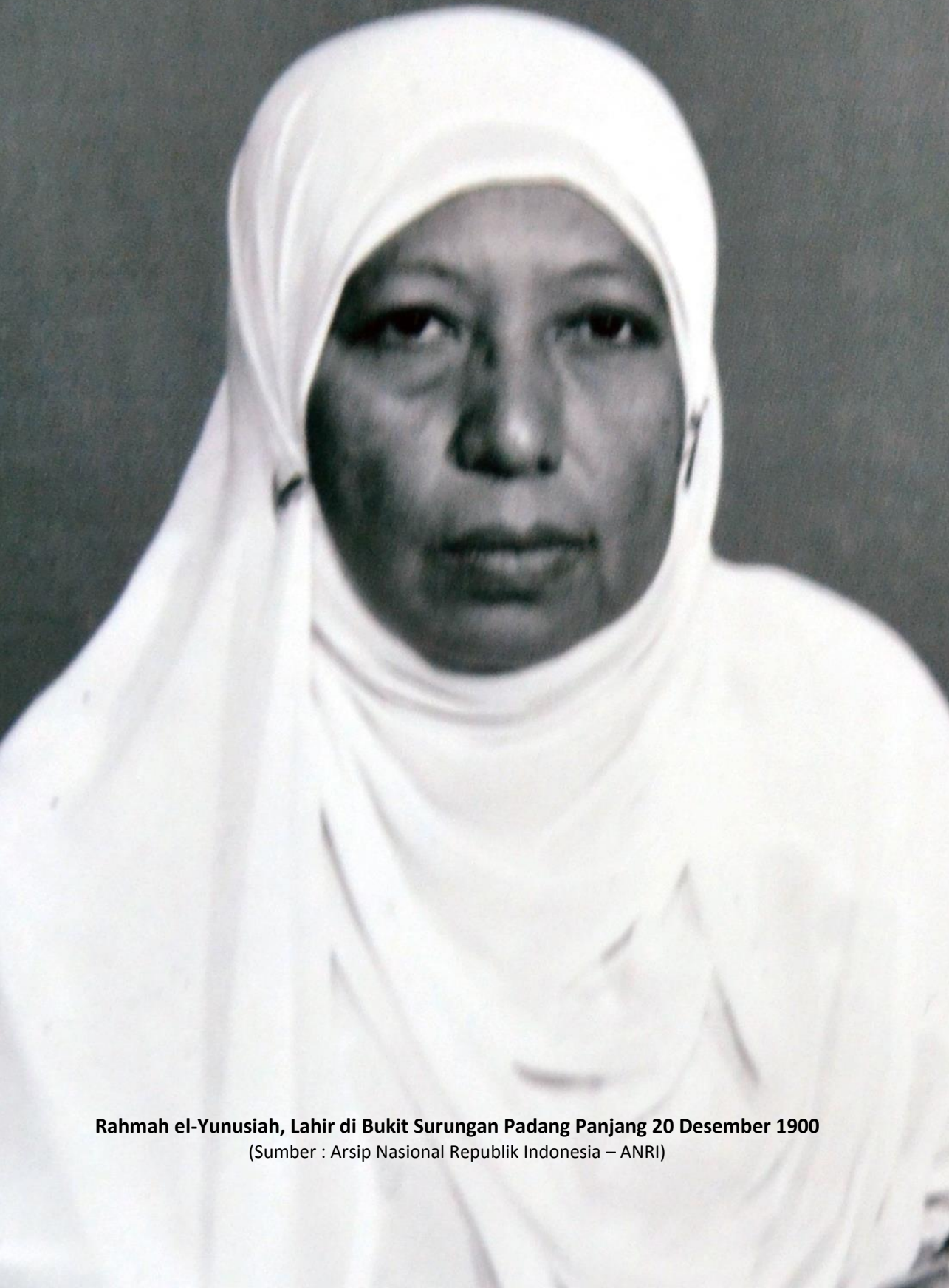
Rahmah el-Yunusiah, Lahir di Bukit Surungan Padang Panjang 20 Desember 1900