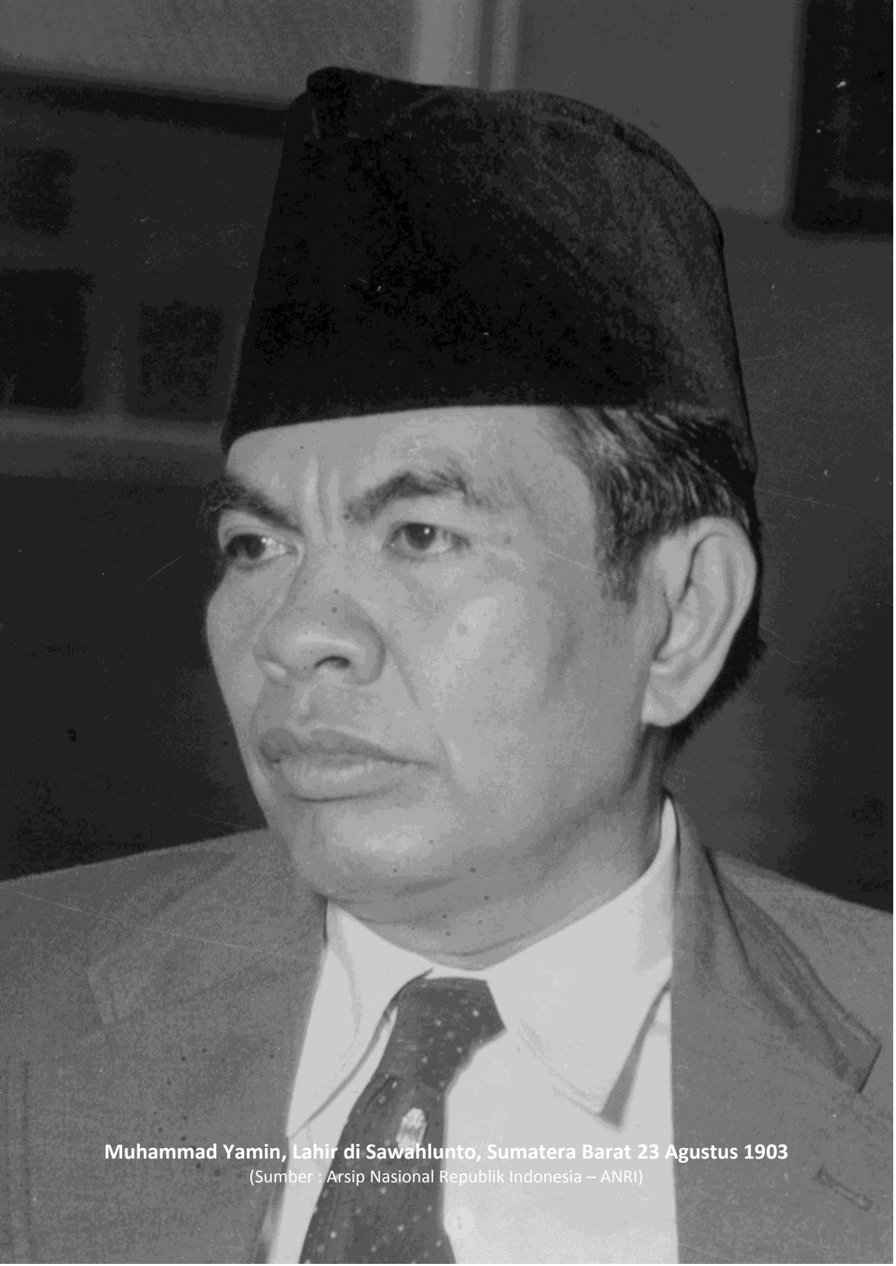
Muhammad Yamin, Lahir di Sawahlunto, Sumatera Barat 23 Agustus 1903