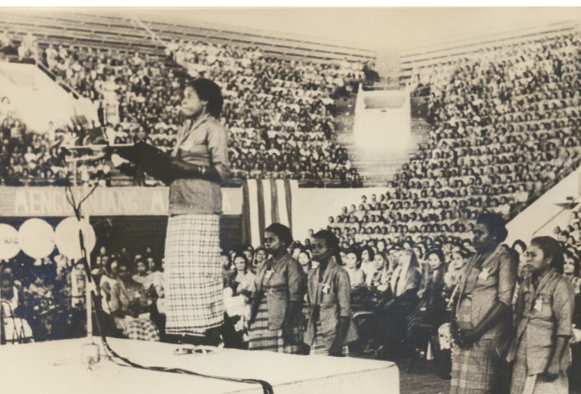
Perwakilan Irian Barat (sekarang Papua) dalam upacara pembukaan Kongres Wanita Indonesia X di Istora Senayan Jakarta pada 24 Juli 1964.