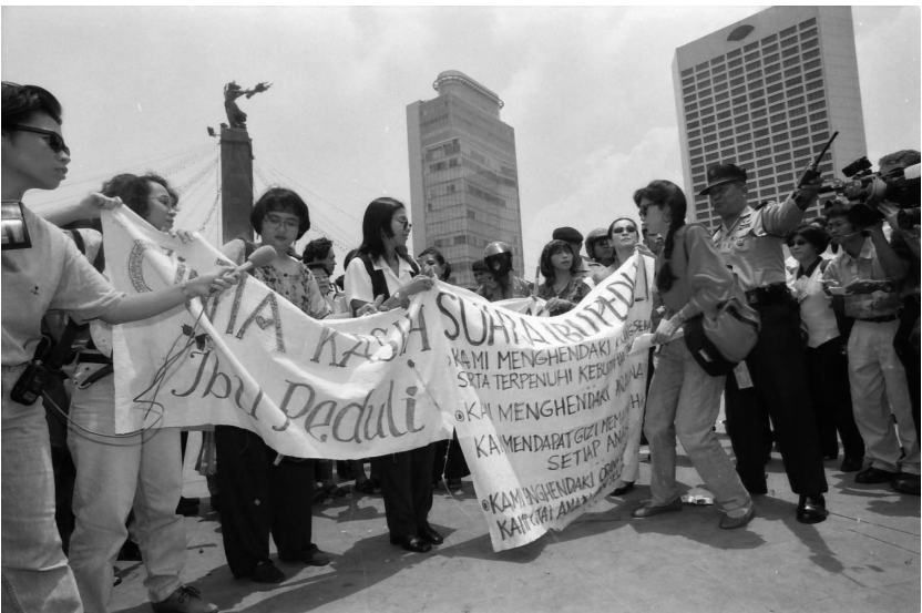
Para aktivis Suara Ibu Peduli menggelar aksi damai di Bundaran H.I. pada Februari 1998.