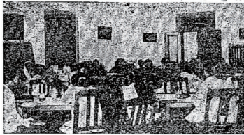
Foto diambil waktue boeka Kongres Poetri Indonesia.