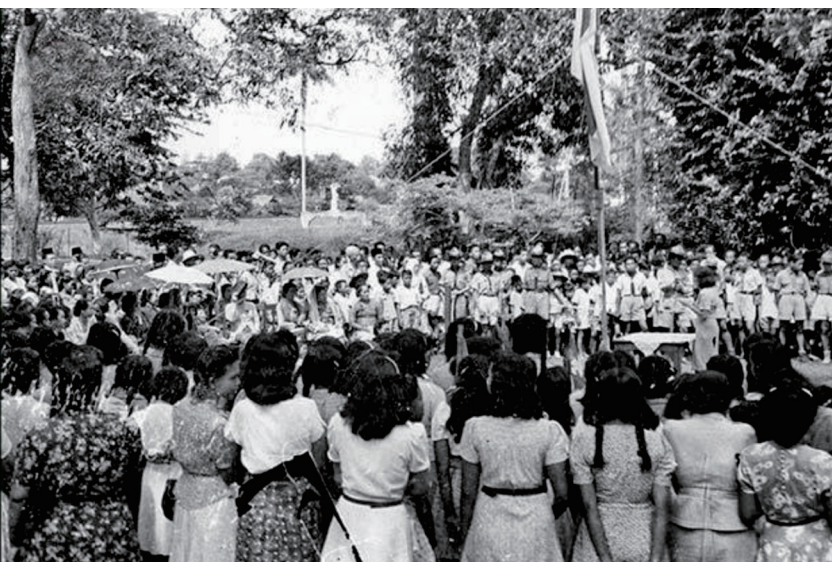
Kiri dan Kanan: Hari Ibu diperingati di Jalan Pegangsaan Timur No. 56 Jakarta pada 22 Desember 1947.