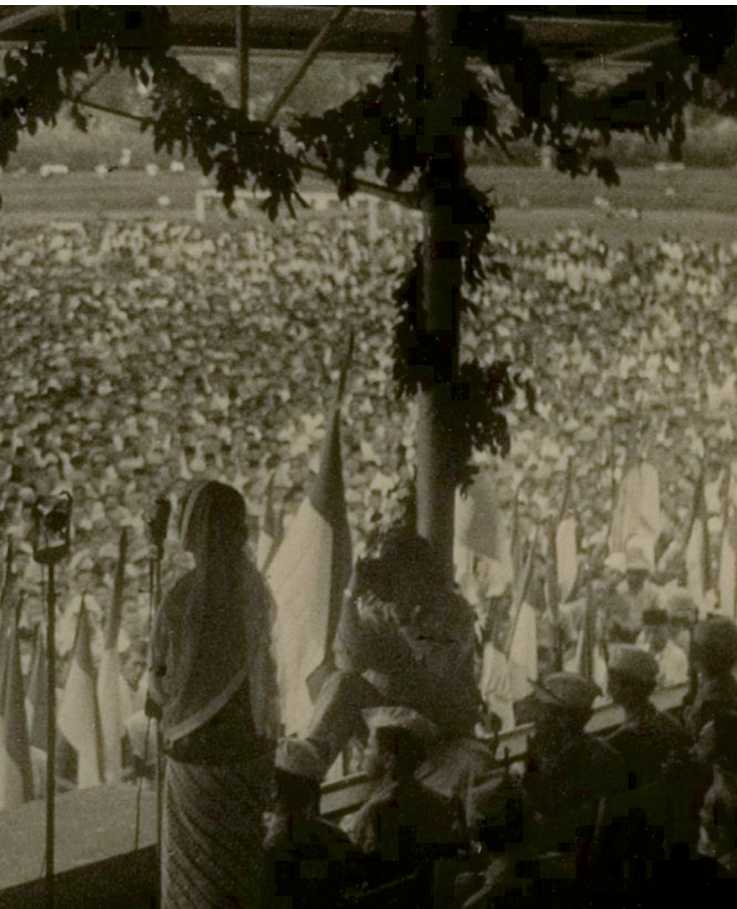
S.K. Trimurti, Menteri Perburuhan pertama dalam sejarah Indonesia, sedang menyampaikan pidato di Yogyakarta, 1947.