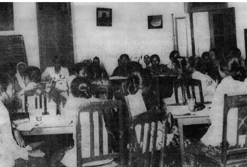
Suasana Kongres Perempuan Indonesia I yang dilaksanakan di Gedung Joyodipuran, Yogyakarta, pada 22-25 Desember 1928. Kongres ini menjadi cikal-bakal ditetapkannya tanggal 22 Desember sebagai Hari Ibu di Indonesia.