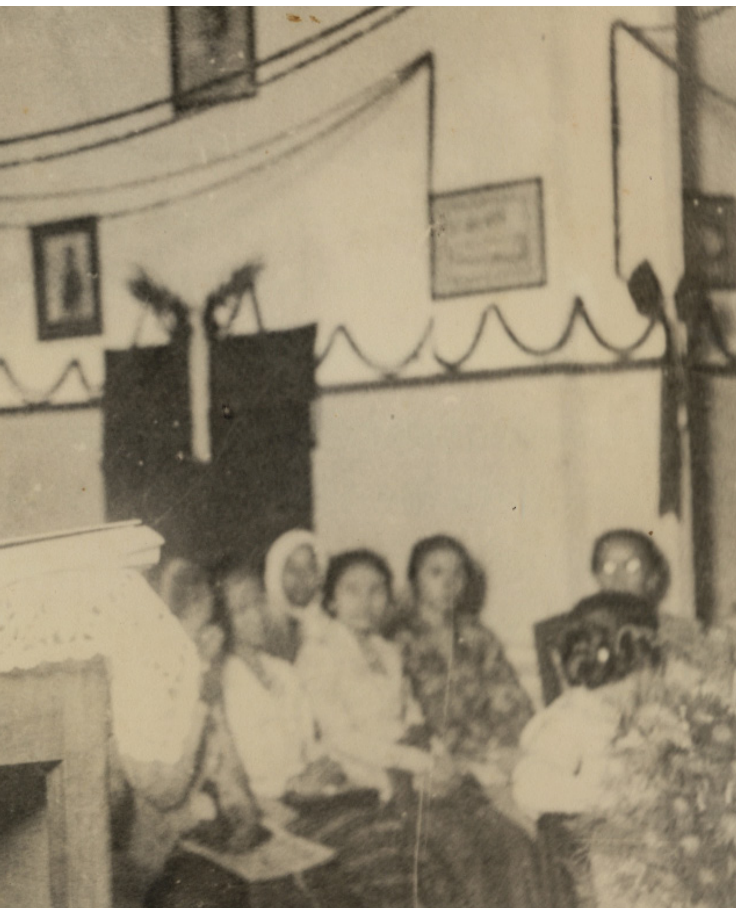
Dr. Soetomo menyampaikan pidatonya pada Kongres PPII di Surabaya pada 13 Desember 1930.