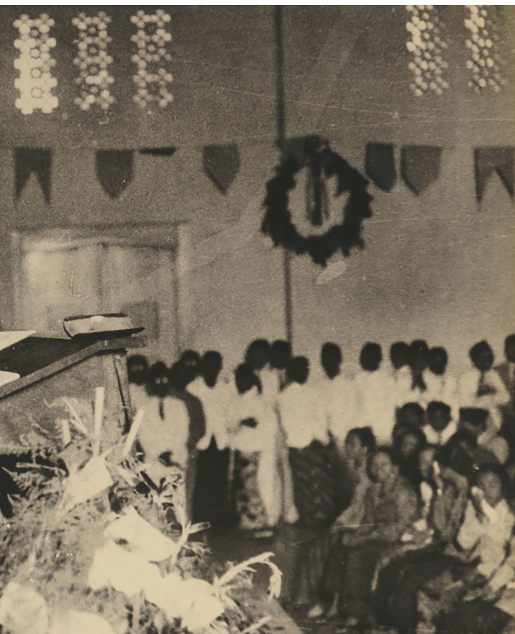
Ki Hadjar Dewantara berpidato pada Kongres Perikatan Perkumpulan Istri Indonesia (PPII) di Surabaya pada 4 Desember 1930.