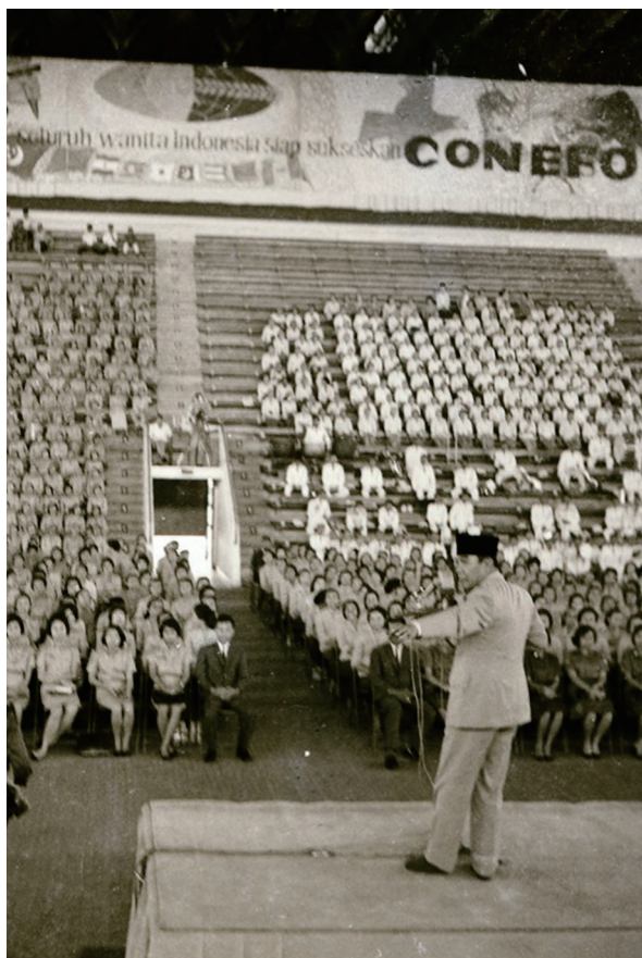
Peringatan Hari Wanita Internasional di Istora Senayan pada 8 Maret 1966.