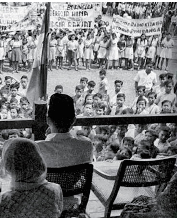
Presiden Sukarno menghadiri Perayaan Hari Ibu di Yogyakarta pada 22 Desember 1947.