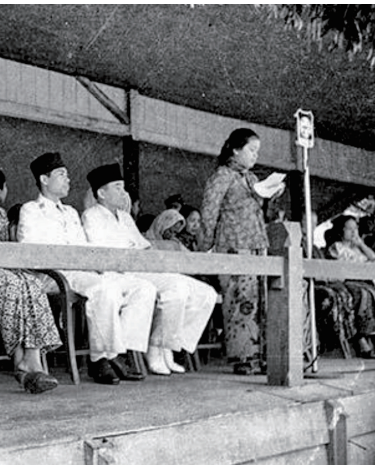
Perwakilan perempuan sedang berpidato pada Perayaan Hari Ibu di Yogyakarta pada 22 Desember 1947.