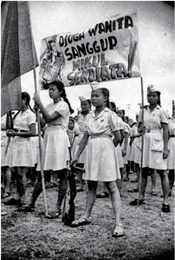
Kiri dan Kanan: Peserta pawai pada Perayaan Hari Ibu di Yogyakarta pada 22 December 1947.