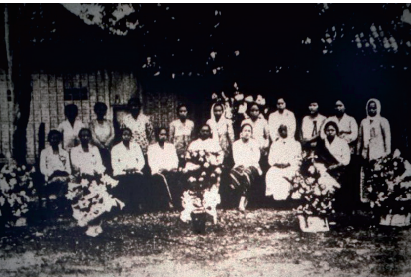
Peserta Kongres Perikatan Perempuan Indonesia I pada 28-31 Desember 1929 di Gedung Nasional, Gang Kenari, Jakarta.