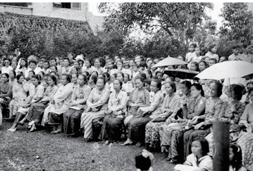
Kiri dan Kanan: Hari Ibu diperingati di Jalan Pegangsaan Timur No. 56 Jakarta pada 22 Desember 1947.