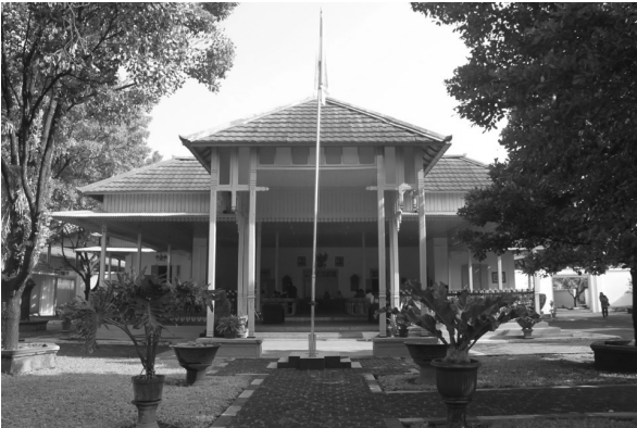
Gedung Joyodipuran, tempat pelaksanaan Kongres Perempuan I pada 1928 dan saat ini menjadi kantor Balai Pelestarian Nilai Budaya, Jalan Brigjen Katamso No.139, Yogyakarta. Atas: foto dipotret pada era 1940an. Bawah: foto dipotret pada 2013.