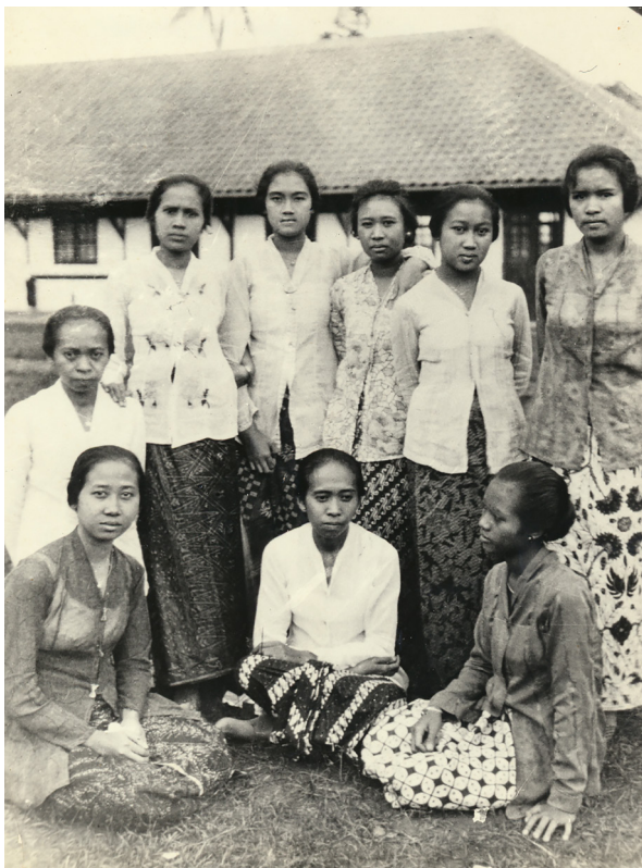
Anggota organisasi wanita Indonesia, ISTRI, berpose bersama pada 1927. Organisasi ini didirikan sesudah Kongres Pemuda Indonesia pertama.