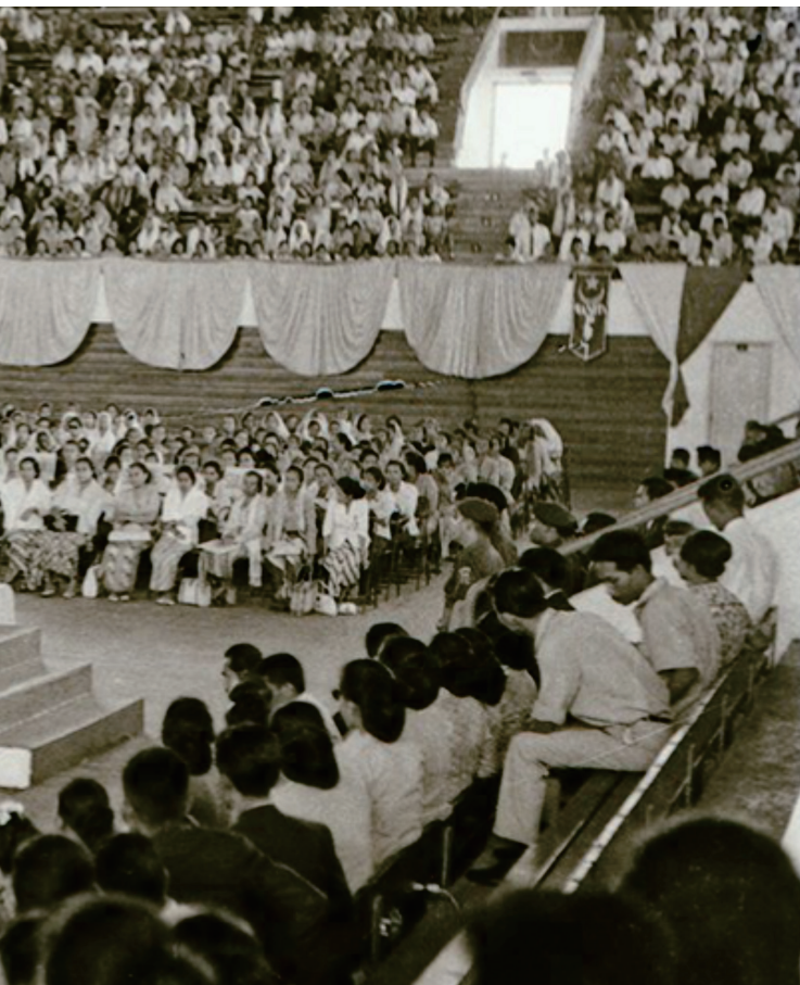
Presiden Sukarno pada wanita PSII di Istora Senayan, Jakarta 1966.