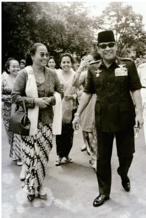
Sukarno berjalan bersama para peserta perayaan Hari Ibu, 22 Desember 1965.