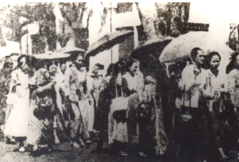
Gabungan sejumlah organisasi perempuan berdemonstrasi menuntut Undang-undang Perkawinan pada 1953.