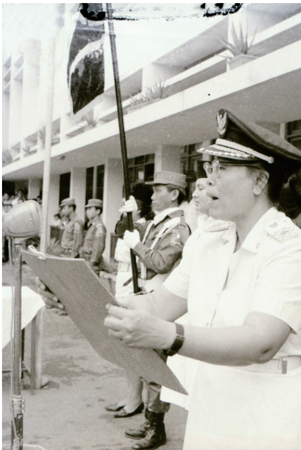
Peringatan Hari Ibu dan Hari Sosial di Departemen Sosial, dipimpin oleh Menteri Sosial Ny. Rusiah Sardjono SH. Jakarta, 22 Desember 1965.