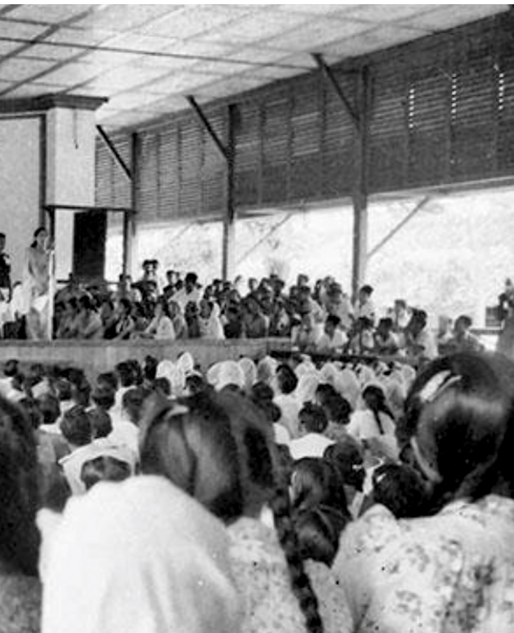
Pembukaan acara kursus politik bagi wanita yang dihadiri oleh Presiden Sukarno di Istana Yogyakarta pada 17 Desember 1947.