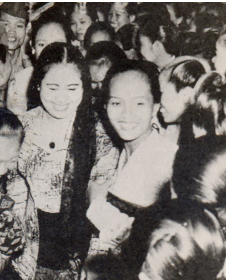
Fatmawati Sukarno bersama segenap lapisan masyarakat dan organisasi perempuan menyambut Hari Ibu di Istana Merdeka, Jakarta, pada 22 Desember 1960.