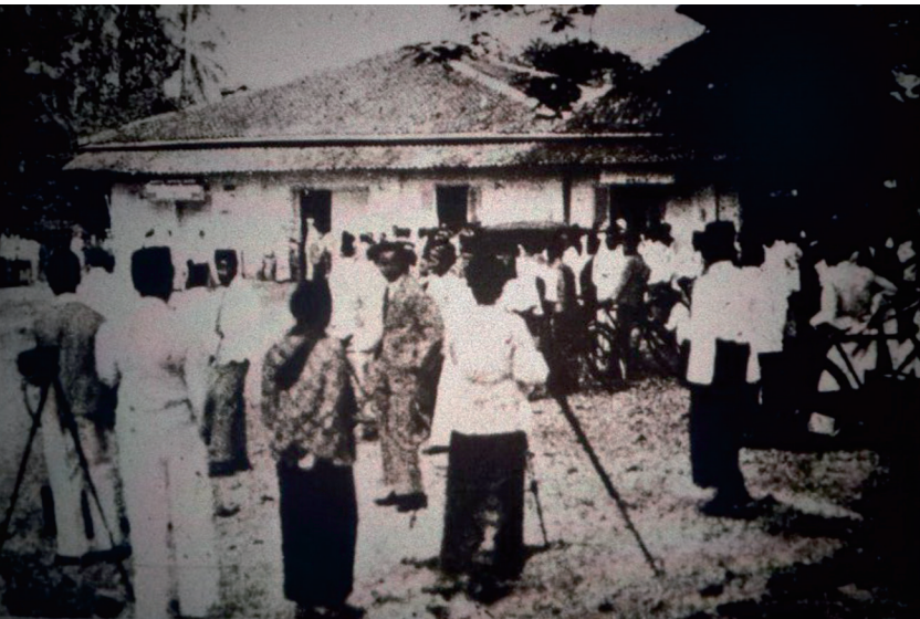
Suasana di depan Gedung Pemufakatan Gang Kenari. Jakarta pada 28 Desember 1929.