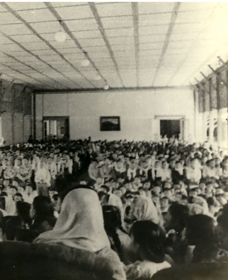
Kursus politik bagi wanita diberikan oleh Presiden Sukarno di Istana Yogyakarta pada 17 Desember 1947.