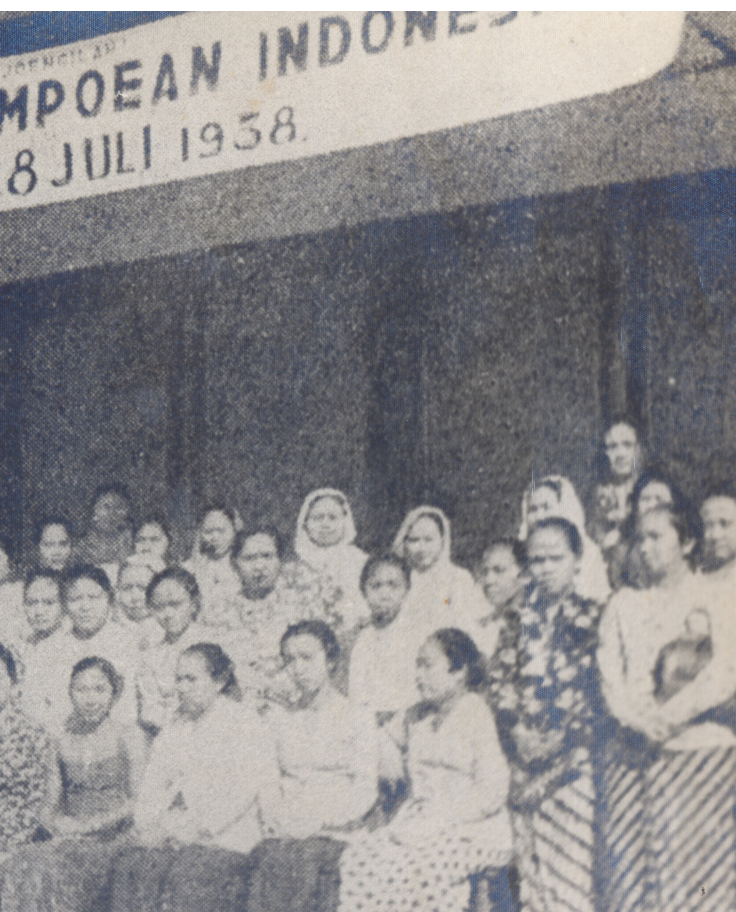
Para peserta dan pengurus Kongres Perempuan Indonesia III di Bandung pada 23 Juli 1938.