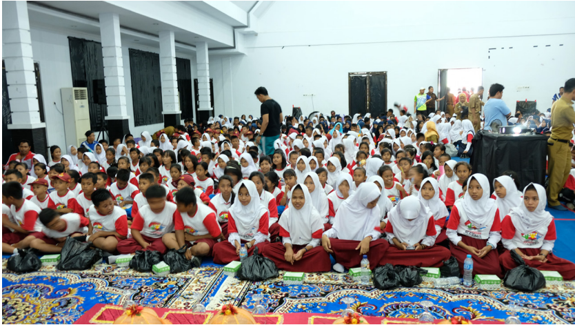
Siswa sedang menyaksikan pemutaran film-film inspiratif.

sudah bisa berpikir mengapa sesuatu terjadi, apa sebenarnya yang telah terjadi, dan ke mana arah kejadian-kejadian itu. Untuk tingkat SMA, seperti film dengan judul HOS Tjokroaminoto Guru Bangsa, Soekarno, Wage, dan G 30 S/PKI dll