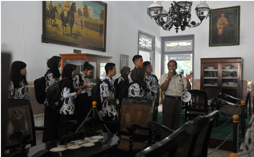
Siswa sedang melakukan lawatan ke Museum Panglima Besar Jenderal Sudirman di Yogyakarta.

Melakukan kunjungan ke tempat-tempat dan bangunan bersejarah dengan tujuan mengenalkan tokoh, benda dan peristiwa sejarah pada siswa. Untuk jenjang pendidikan SD, kegiatan ini dapat berupa kunjungan ke museum. Untuk SMP dan SMA/SMK, kunjungan ke tempat-tempat bersejarah untuk melihat secara langsung tempat terjadinya peristiwa bersejarah sehingga dapat memberikan wawasan dan kesadaran kesejarahan sangat direkomendasikan. Selain itu, melalui karya wisata, peserta didik dapat melakukan kunjungan ke kantor arsip dan perpustakaan untuk mengenalkan sumber sejarah. Nilai yang terkandung dalam kegiatan ini adalah apresiasi terhadap sejarah dan budaya bangsa sendiri, cinta tanah air, dan menghormati keragaman budaya.