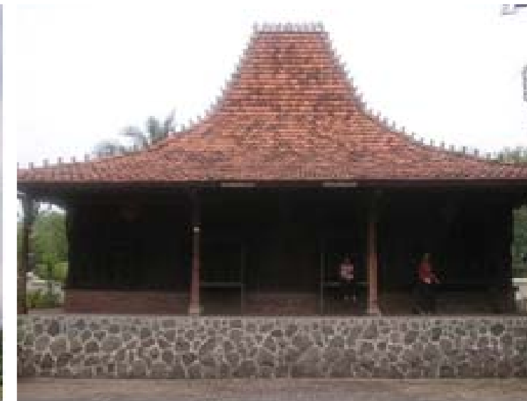
Rumah Joglo: Jawa Tengah