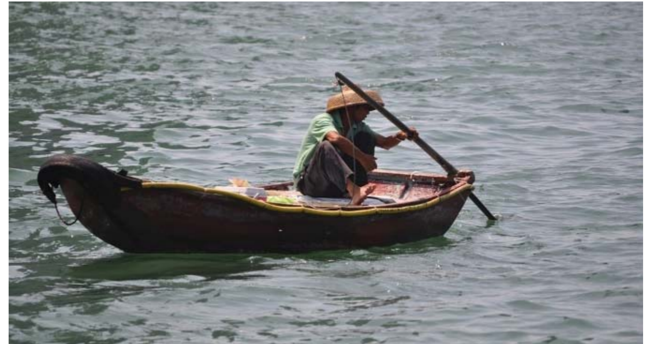
Gambar: nelayan sedang mencari ikan di laut