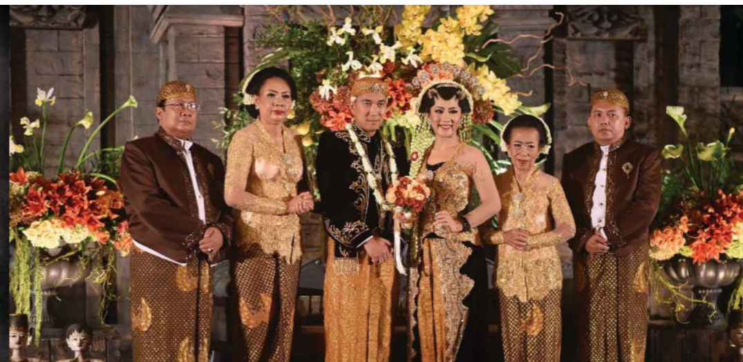
Upacara Pernikahan Adat Jawa