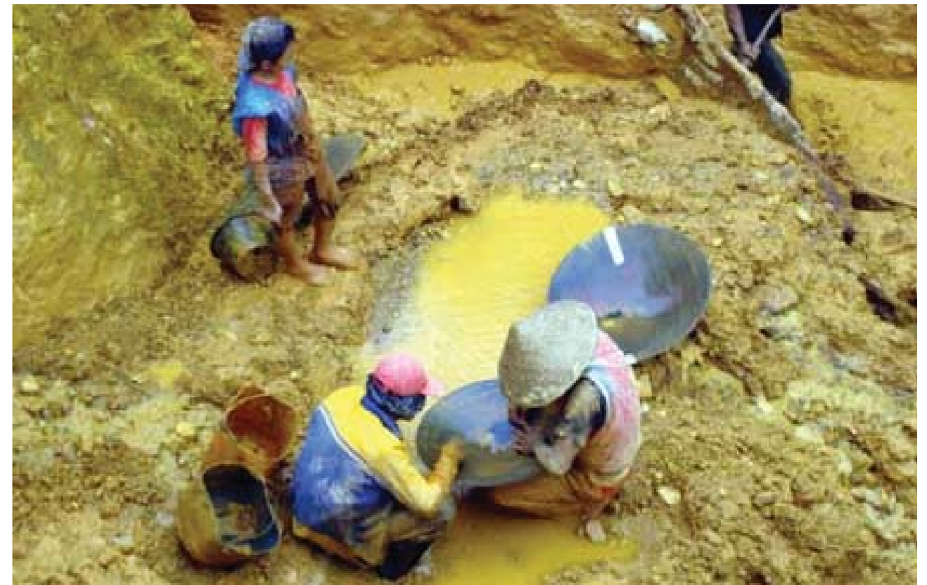
Gambar: Para penambang sedang menambang emas