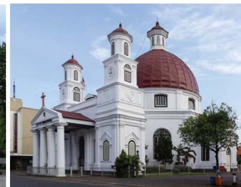
Gereja Kristen Protestan