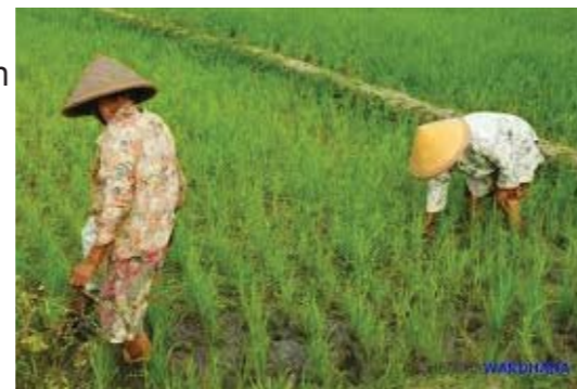
Gambar: petani sedang menanam padi