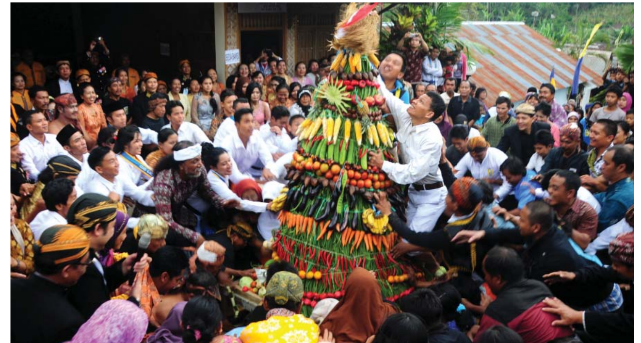
Upacara Grebeg Suro

Upacara Grebeg Suro dilaksanakan oleh keraton Kasunanan Surakarta sebagai sarana memanjatkan doa dan mencari berkah serta sebagai bentuk penyampaian nilai moral kepada masyarakat di sekitarnya.