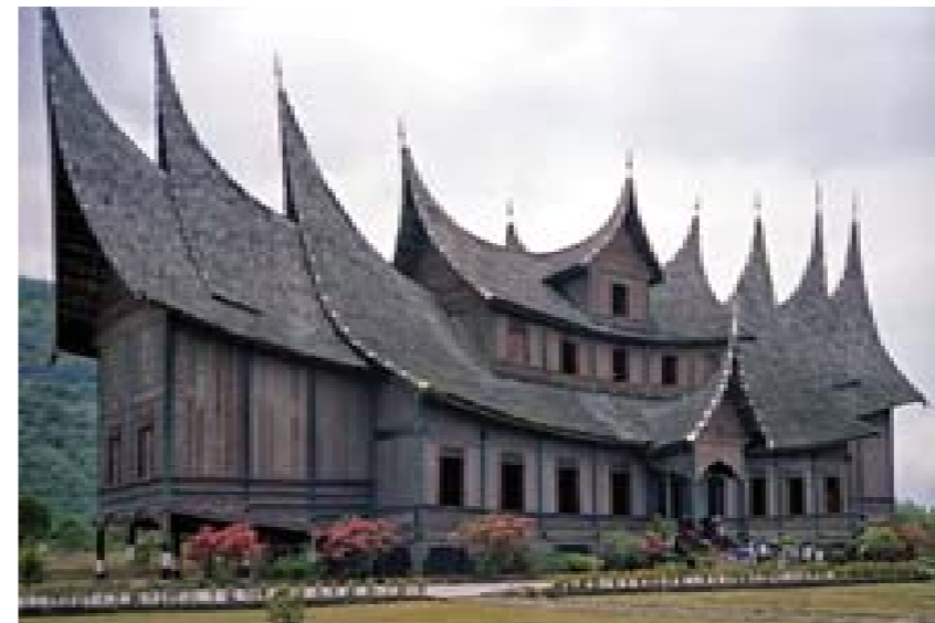
Rumah Gadang: Sumbar

Contoh Rumah Adat dari beberapa suku yang berada di wilayah Indonesia: rumah gadang (Sumbar), rumah joglo (Jawa Tengah), rumah Lamin (Kaltim), rumah Tongkonan (Sulbar)