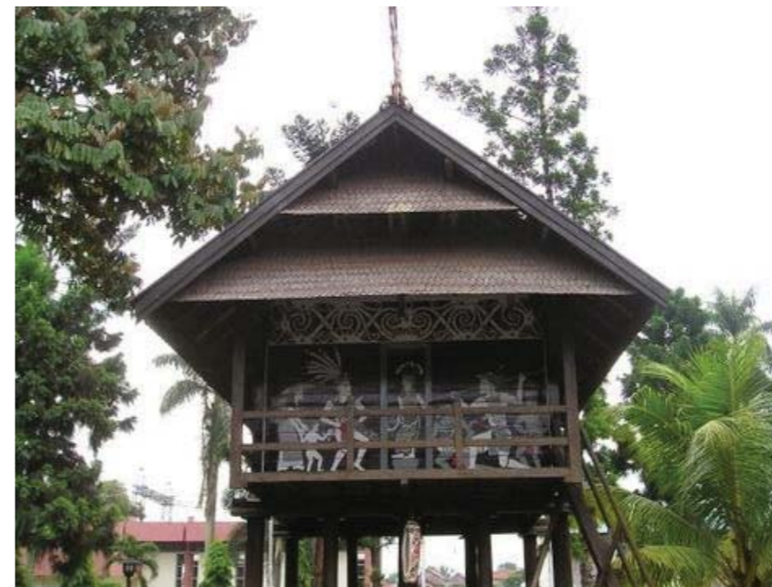
Rumah lamin: Kaltim