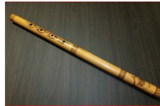
Saluang- Sumatra Barat