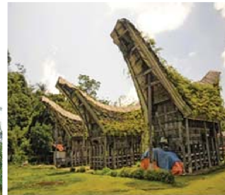
Rumah Tongkonan: Sulbar

Tulislah nama rumah adat lain yang Anda kenal pada kolom berikut.