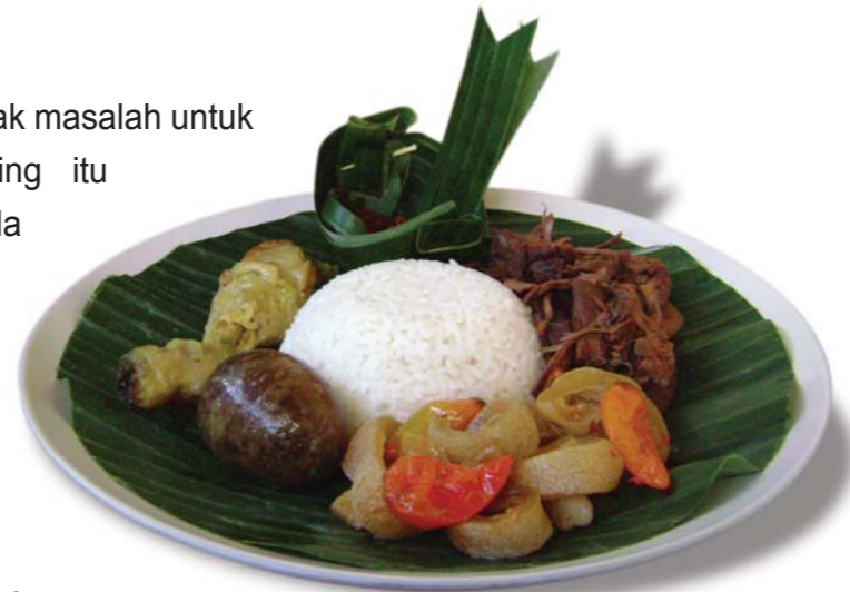
Gambar. Nasi gudeg

pola atau skema warna tertentu, tak masalah untuk menggunakannya. Pastikan piring itu melengkapi makanan yang Anda sajikan dan bukannya bersaing merebut perhatian.